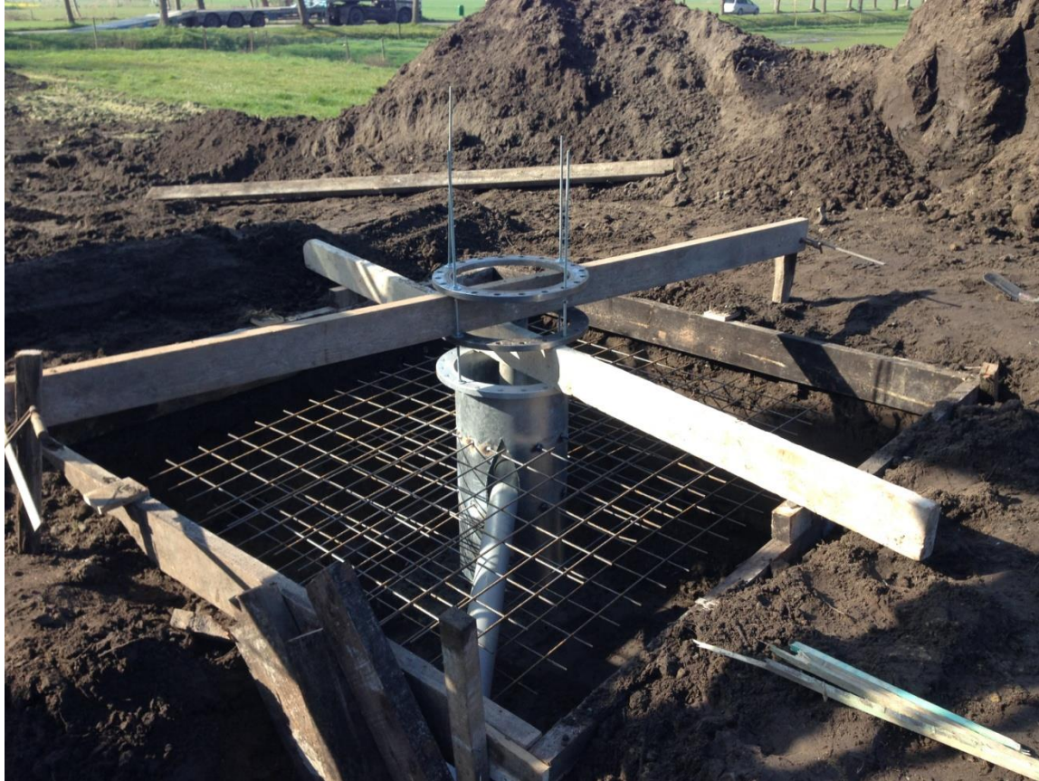
De fundering met wapening en wachtbuis.